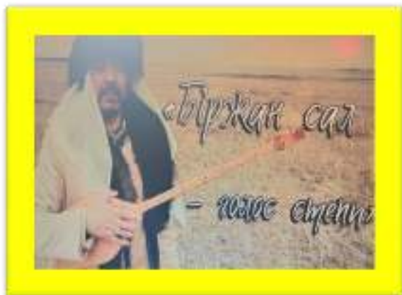
«Тайны. Судьбы. Имена». «Біржан сал - голос степи»