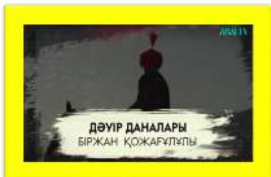
«Дәуір даналары. Біржан сал»