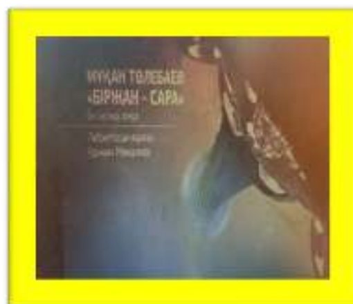
Мұқан Төлебаев «Біржан мен Сара» ASTANA OPERA опера және балет театры Либреттосын жазған Қажым